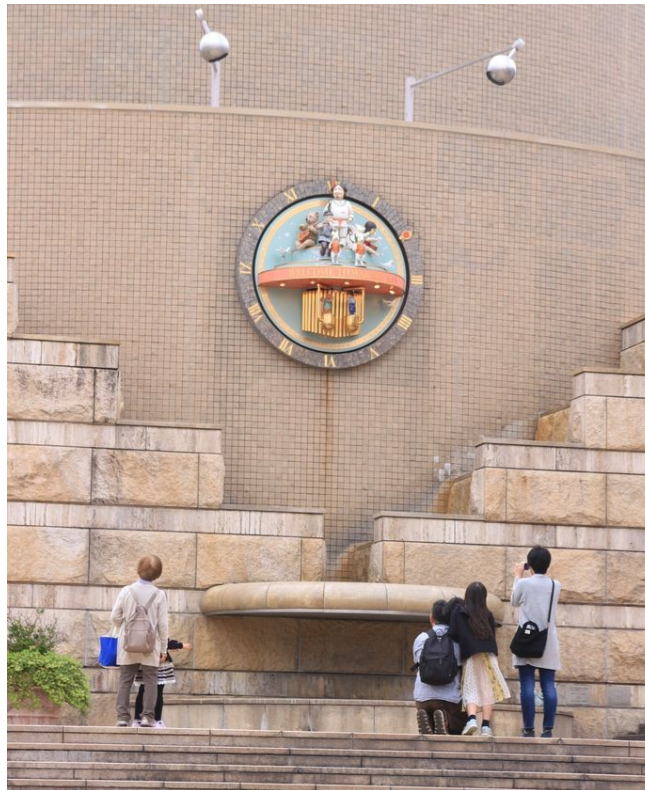
Spieluhr an der Außenwand des Warabekan, Tottori

Die Ziele des Partnerschaftsvereins Tottori-Hanau e.V. (nachfolgend PVTH) haben mich überzeugt und ich möchte diese durch meine Mitgliedschaft unterstützen: