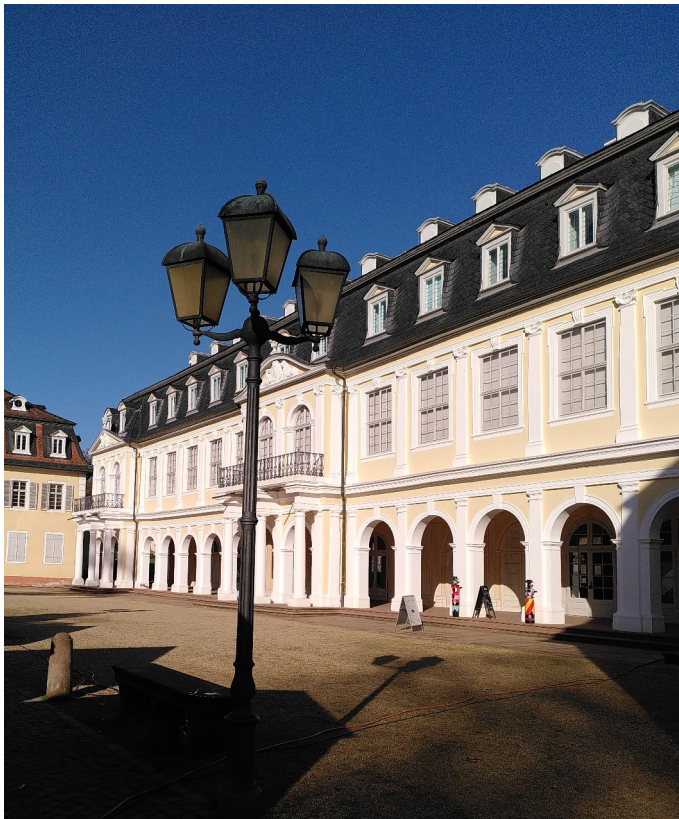
Hessisches Puppen- und Spielzeugmuseum